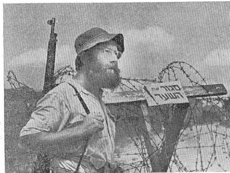
על הכשפר בנגב

החוק מיוחד ישנו לחברינו במסגרת צבא התנגד לישראל. יודע הדבר שמלחמה עלולה לטרת יצרים שונים ורדודים בחובו של אדם אשר לא יהיו מרענים במסירות רגילות. כך הוא טבעו של שלום וכך הוא דבחה של מלחמה. מבטחה חכמה זו ביטוי גם ברינו החרוד. אין אנו מצאים מקום. בו דבחה תורה נגד יצור הרע בצורה כזו ברובת כבוד בנתיק המלחמה. בהם היא התורה. יפה תבא" - והתיר אשר אין דוגמתו בכל התורה בכל. גם במלחמת ישראל ערים אנו להופעות בלתי מסמכות של גילוי יצור לב האדם חרם. והחיינו על כך כבר טעל עמודי התנגות. אין לחומי ישראל. הלוחמים את מלחמת. העם והארץ. אשר לא יבאו לבנושים בתם. אשר לא יבאו לפלול שלל. אין הם אשר חיונכם יהיו צריך לטעם מרשים בעד פעולות טובות אשר לא לרוב המוסר. אין הם לא טעם טמנה זו על צדדי יצריהם יודעים אנו כי לאין ערוך טובה התנועה והתנועה קלמטי חילול אוריים. אבל עם הכל גם ידענו לא ויהת נקרא וגם אנו נכסלנו. על כן התקיר כפול ונכסיל מוטל על חילוי ישראל והאנונים לתורה. תורה מבינה. מבינה מכל צדה שלא תבא ומענה על אדם