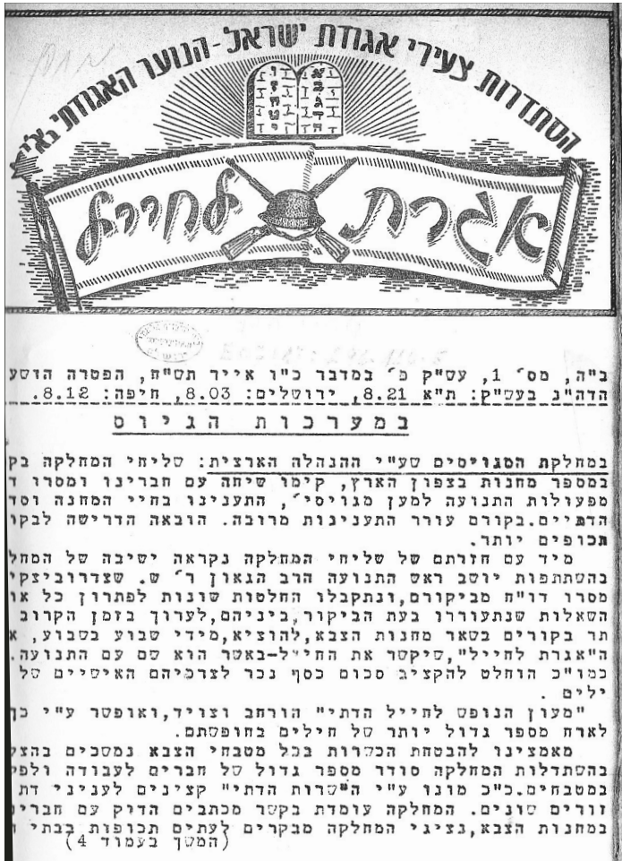
אגרת לחייל מטעם הסתדרות צעירי אגודת ישראל, אייר תש"ח.

הגיליון המוגדל (יא) שיצא באמצע חודש טבת תש"ט ושהיו בו שמונה עמודים, עסק ברובו בחגיגות ואירועים בערים השונות במלאת עשר שנים לתנועה. רק עמוד אחד הוקדש ל"במת החייל" ובו ארבעה מאמרים של חיילים שעסקו בשירות הצבאי ותמונת קבוצת חיילים מפלוגה דתית שנלחמו בנגב. 40