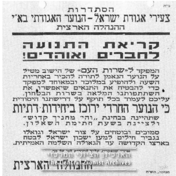
הנחיות צעירי אגודת ישראל למתגייסים מטעם הארגון, חנוכה תש"ח.

צבי דושינסקי, הרב הראשי של היהדות החרדית, החמיר יותר במתן היתרים לפעילות בשבת והסביר את עמדתו במכתב ששלח לרב הרצוג בראש חודש סיון תש"ח (8.6.1948) ובו ציין שהוא מעדיף שהפונים בעניין זה לא יפנו אליו. 20 פתרון הבעיות שהתעוררו לא היה פשוט. מוסדות היישוב היו בתחילת דרכם בניהול מדינה וארגוני המחותרת החלו בהסבתם לצבא מסודר. הצבא התארגן תוך כדי לחימה כשהוא סובל ממחסור בתחומים רבים: כוח אדם מאומן, נשק וציוד חיוני. גם בתחומים שנקבעו בהם הוראות ונהלים לא תמיד הם הגיעו ליחידות ולא תמיד ידעו איך ליישם אותם. כך היה גם בתחום הדתי. הרבנות הצבאית הייתה בראשית דרכה ונעזרה ברבנות הראשית כדי לפתור בעיות הלכתיות שעדיין לא היו להן תקדימים. המתגייסים הדתיים והחרדים, במיוחד מי שחיו עד גיוסם בחברה סגורה ללא מגעים משמעותיים עם החברה הכללית, התקשו להתמודד. הארגונים והמפלגות שעודדו את הגיוס הבינו עד מהרה שעליהם לסייע למגויסייהם להשתלב בצבא, לדאוג לזכויותיהם ולפתור את הבעיות שהתעוררו. בדיווח של צעירי אגודת ישראל על פעילותם מראשית מארס 1948 נאמר כי עיקר עבודתו של הארגון היא במחלקת הגיוס בגלל הקשיים שבהם נתקלים המגויסים: "בכמה מחנות יש לציין את שרירות לבם של מפקדי המקום, ושאיך ורק בגלל זה מאכילים במקומות הללו מאכל טרף, והדתיים צריכים להסתפק רק באוכל המותר. קרה גם שמפקדים הכריחו לחלל את השבת אף לדתיים". בהמשך הדיווח נאמר שבמקומות